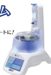
AFC qEV用オートフラクションコレクター

qEVの抽出・洗浄作業がマニュアルからオートに! AFCは重量による検出でフラクションを自動で回収していく為、作業による差も発生しにくくなり、これまで以上の再現性を獲得できます。