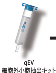
qEV 細胞外小胞抽出キット