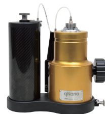
qNano ナノ粒子マルチアナライザー